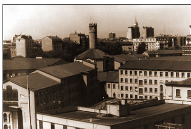
foto: carcere di San Vittore