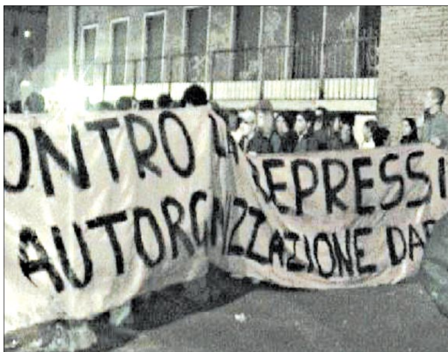
Roma: gli studenti del Virgilio manifestano contro i controlli della polizia

Ciò detto vediamo quali sono gli indirizzi e le finalità di questo riassetto. I provvedimenti del governo vanno in una direzione ben precisa, oltre la diatriba scuola pubblica / scuola privata. Mirano a soddisfare le esigenze usa e getta delle imprese e a rendere il processo formativo più funzionale alle logiche di mercato. La competitività inter-sistemi determina tempi e modi del processo formativo. Le imprese chiedono