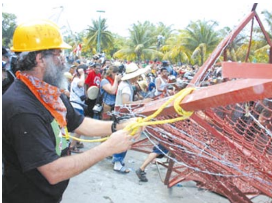
Cancun: i manifestanti attaccano la zona rossa

Il commercio mondiale riflette la logica negoziale dei paesi dominanti. La logica negoziale dei paesi imperialistici è quella di avere libero accesso sui mercati degli altri e proteggere i propri dagli altri. La posizione negoziale dei paesi dominanti è viceversa quella di arginare l'invasione dei prodotti altrui e ricercare spazi per i propri. Nella pratica sono poi i rapporti di forza economico-commerciali a determinare il concreto regolamento degli scambi. In agosto, prima del vertice, USA-Canada e UE avevano concordato un accordo quadro diretto a riequilibrare i diversi tariffari sull'agricoltura. E pensavano che questo accordo, di salvaguardia dei loro sistemi agricoli supersussidiati, venisse accettato dagli altri paesi. L'accordo prevedeva una riduzione del sostegno interno agli agricoltori e dei sussidi e crediti all'export nonché l'ampliamento dell'accesso al mercato. E contemplava altresì i dazi industriali, gli investimenti, e la c.d. trasparenza degli appalti . A Cancun, sotto la pressione del Sud del mondo, è saltato questo accordo-quadro nord-atlantico . Non solo. È saltata la stessa intesa base occidentale USA-UE (da soli USA e UE tota-