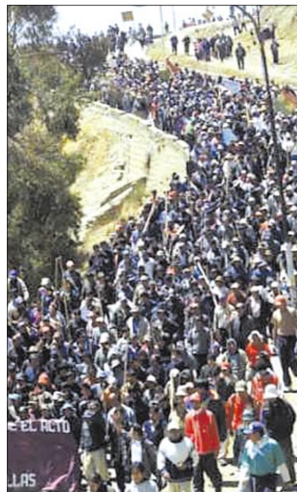
Bolivia: minatori e contadini marciano sulla capitale