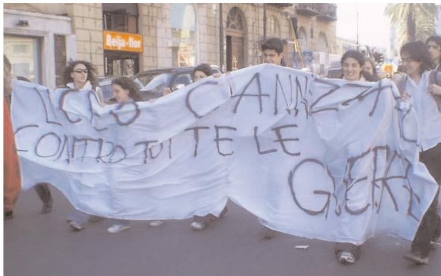
Palermo: un gruppo di ragazze ad un corteo studentesco

3°) Assumere e praticare i principi del marxismo; lavorare alla costruzione del partito rivoluzionario; trasformare l'impegno pratico in militanza piena; consapevoli che questa è necessaria alla conduzione stabile delle lotte e alla direzione del movimento di lotta per il