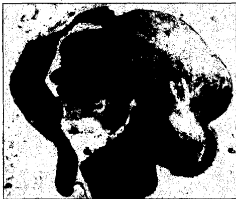
Stefano Ricci, illustrazione per «Il piccolo Claus e il grande Claus»